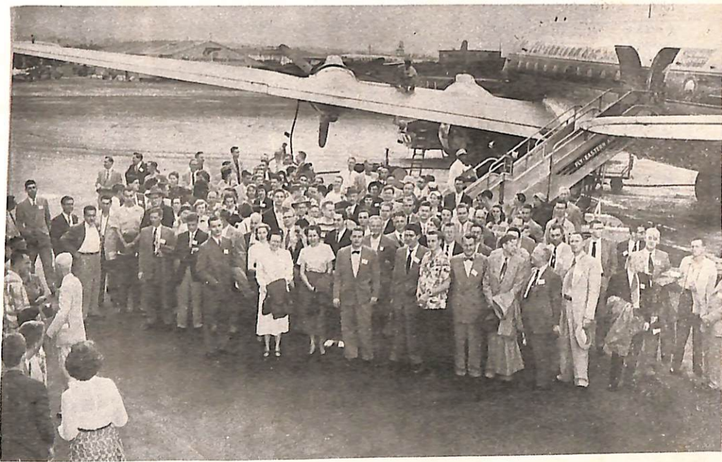
La foto recoge la llegada de los delegados a la Convención Nacional de la Sociedad Honoraria de Historia que se celebró con gran brillantez en la isla hace dos semanas.